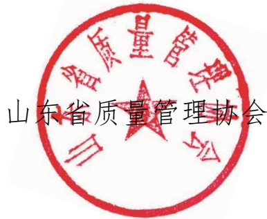
山东省质量管理协会