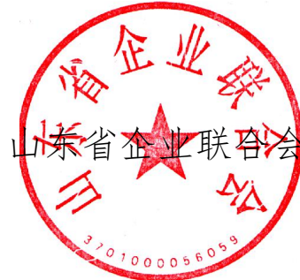
山东省企业联合会