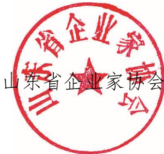
山东省企业家协会